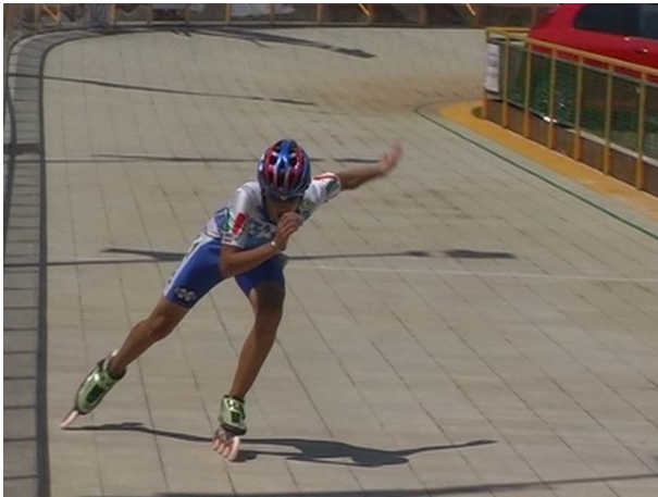
Bugari...e la cronometro