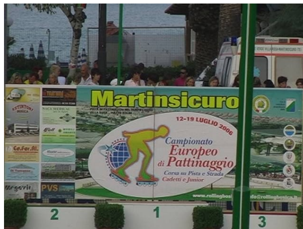
Il logo della manifestazione continentale

Ho avuto modo di partecipare in questi ultimi anni ad iniziative di varie federazioni estere, alcune di queste hanno chiamato tecnici di pattinaggio esperti, forse la strada che hanno intrapreso sarà quella giusta?