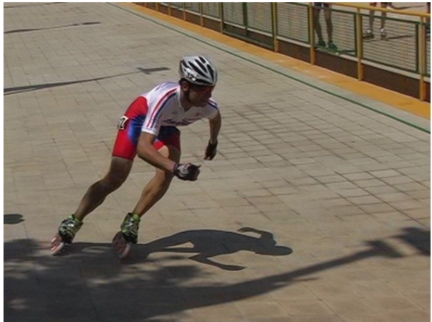
non male i francesi nella velocità

In bocca al lupo a tutti gli atleti impegnati nel Campionato Europeo Giovanile di Martinsicuro. Che l'impegno degli atleti sia per tutti i dirigenti di tutte le nazioni europee un forte stimolo di crescita di tutto il movimento.